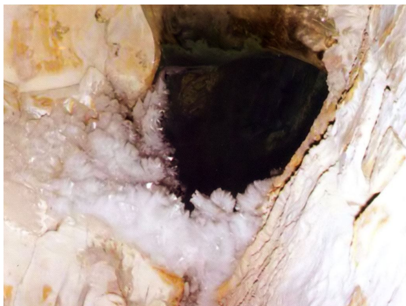
Рис. 1 Памятник природы республиканского значения "Кульдюкская пещера" (вверху – общий вид, внизу – вход в пещеру)