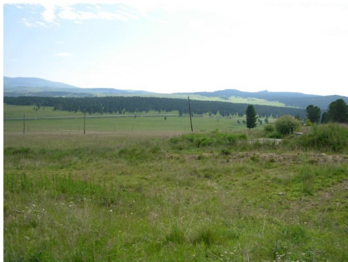
Рис. 1 Памятник природы “Семинский перевал” вверху - северная часть территории памятника природы, в середине - его центральная часть, внизу - южная часть