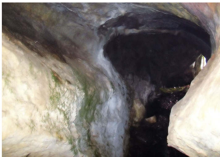
Рис. 1 Памятник природы республиканского значения "Пещера Музейная" (сверху – общий вид, снизу – вход в пещеру)