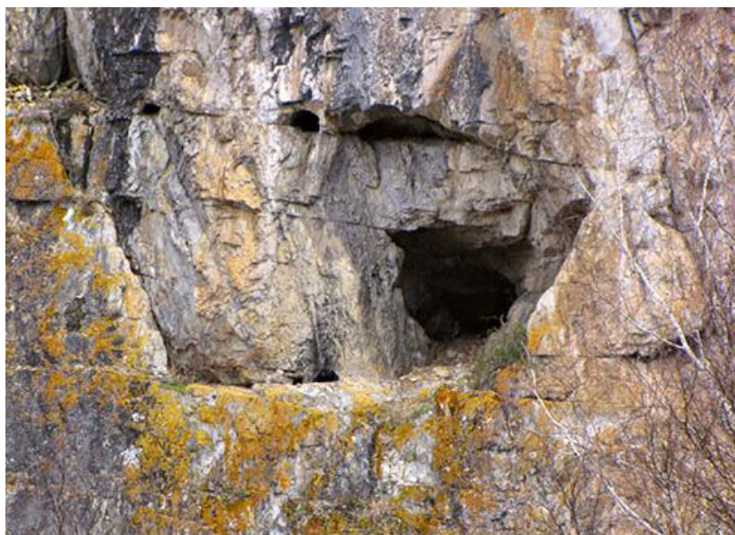
Рис. 1 Памятник природы республиканского значения "Пещера Таркольская"

К основным неблагоприятным факторам воздействия и угрозам относится массовый туризм.